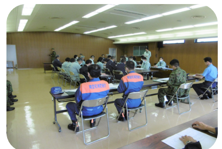
▲災害対策本部設置訓練