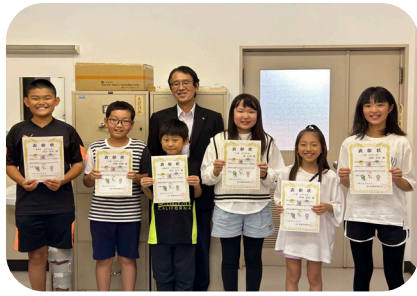
▲小学生の部受賞者

「心とからだこども元気プラン」の啓発ポスター募集事業の入賞作品が決定しました。 この事業は、子供たちが望ましい生活習慣や規範意識を身につけることを目的に、「早寝、早起き、朝ごはん運動」や「心を潤すあいさつ運動」、「もったいない運動」、「体カアップ運動」の4つを