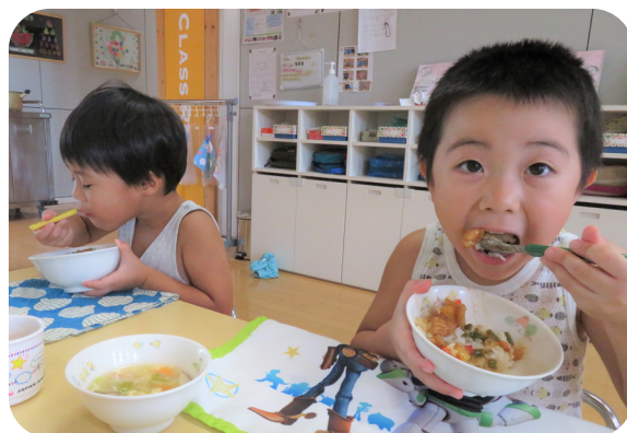
▲おいしそうに「由仁のものの学校給食」をほおぼる三川保育園児