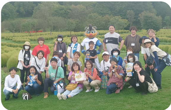
▲ゆにガーデンにて

9月17日、18日、北海道日本ハムファイターズのマスコット「B・B」と町内を巡るツアー「B・Bと満喫！由仁町周遊ツアー」が行われました。北海道応援大使プロジェクトの一環として開催され、カフェレストランでの食事やさつまいもの収穫体験のほか、町内のビュースポットを巡るなど、町外から訪れた参加者が由仁町の魅力を満喫しました。