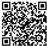
▲ 由仁町デマンドバス LINE アプリ

くわしくは地域活性化課地域活性化担当までお問い合わせいただくか、町の公式ホームページをご覧ください。