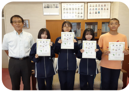
▲中学生の部受賞者

「心とからだこども元気プラン」ポスター入賞作品決定 問 教育課社会教育担当 ☎ 0123-83-3904