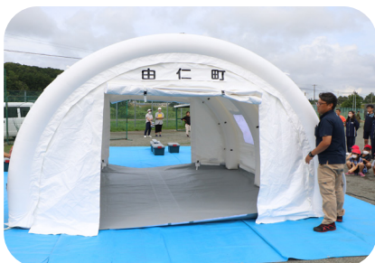
▲ドーム型テントの設置訓練

北海道胆振東部地震の発生から5年目となった9月6日、防災意識を高めるため、新型コロナウイルスのまん延により中止していた防災訓練を4年ぶりに開催しました。役場3階での、大雨災害を想定した自衛隊、警察、消防の協力を得た災害対策本部設置訓練にはじまり、その後は場所を中学校に移し、小学校・中学校合同による大雨を想定した避難訓練やバケツリレーを実施しました。自衛隊の特殊車両やパトカー、救急車などの車両展示は、子供たちに人気でした。