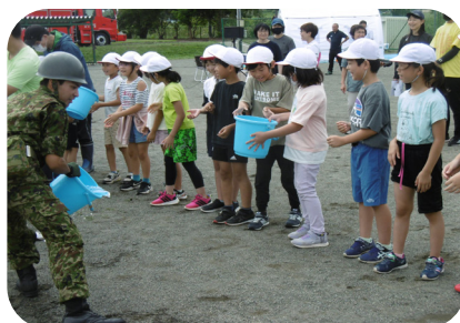
▲小学生によるバケツリレー