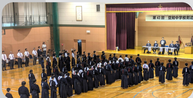
▲生まれて初めて剣道の大会を観ました。礼節と気迫が同居する会場は圧巻です。

どうかその人たちに感謝することを忘れないでください。それがスポーツを愛するということです。自分がスポーツを愛することで、同じくスポーツの神様が自分を愛してくれるようになり、自分をより高みへと連れて行ってくれます。