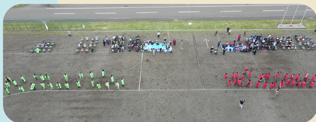
▲6月は運動会・体育大会の時期です！ みんなケガ無く頑張ろうね！

子供たちが興味を持っているゲームやSNSなどを自分自身で調べることで、子供たちがどのような情報に触れているか理解し、適切な対応ができます。さらに、ポジティブなコミュニケーションも大切にし、オープンな態度で子供たちとオンライン活動に関する話題を共有することで、親子の信頼関係を築くとともに、悩みや不安に気づく機会も増え、なお良い結果が得られます。