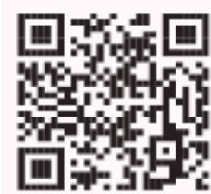
▲専用ホームページ https://hkd2023.kosodate-ouen.jp

②郵送申請：専用ホームページからダウンロード、健康元気づくり館または役場住民課窓口にて申請書類を配布