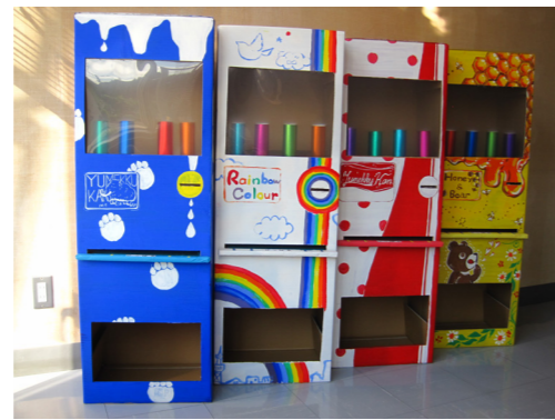
△くじ引き自動販売機

日時 9月25日(土) 10時30分～ 場所 ゆめっく館 正面玄関前 対象 幼児、児童、保護者 内容 パネルシアター、絵本、手品、ワークショップ、くじ引き自動販売機 参加すると「おはなしマップカード」のシールがもらえます。参加無料です。 ※雨天の場合は、館内で行います。