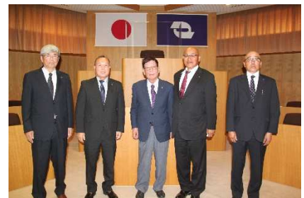
産業厚生常任委員会