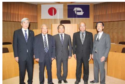
総務文教常任委員会