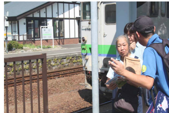
△イベントでのJR利用促進

地域密着型観光列車モニターツアーを実施し、地域の観光資源の利用促進を検証しました。