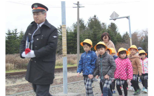
△幼保連携交流事業