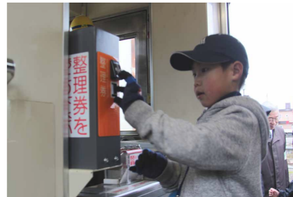
△幼保連携交流事業