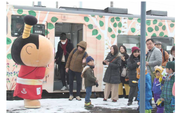
△観光列車モニターツアー