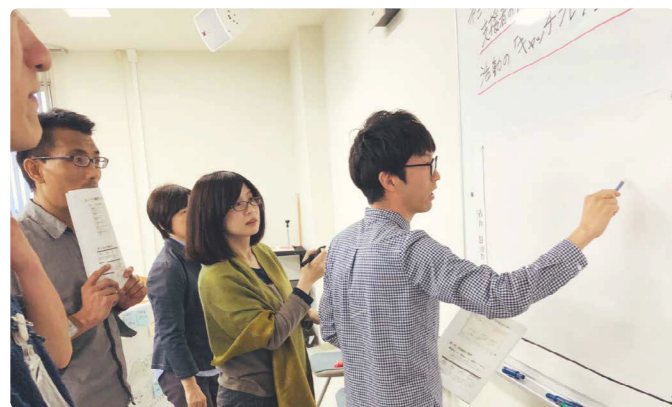
滋賀県大津市で行われた地域おこし協力隊・初任者研修。グループに分かれてのワークショップでは、活発な意見交換が行われました。

全国各地から地域おこし協力隊・集落支援員、合わせて約150名が出席。3日間、同じ施設内で寝食を共にして“地域おこし”について学びました。研修内容は、講師陣・地域おこし協力隊 OB による講義、グループ分けされて行われたワークショップの大きく分けて2種類です。直ぐに実践できるものから、いずれ必要になるものまで、3日間だからこそそのとても内容の濃い研修会でした。今回学んだことを今後の活動に取り入れていき、任期終了となる2年後をより良いものにしていきたいと思ひます。