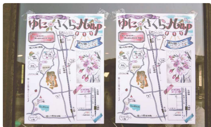
4月29日の植樹祭に合わせて描かせていただいた、由仁町のさくらマップ。当日は天候にも恵まれ、青空の下で桜の苗木が植えられました。