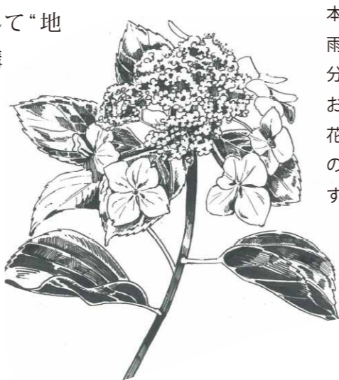
本州ではそろそろ梅雨の季節。憂鬱な気分になりがちですが、お気に入り花、紫陽花が満開になる頃なので今から楽しみです。(画 石塚あゆみ)