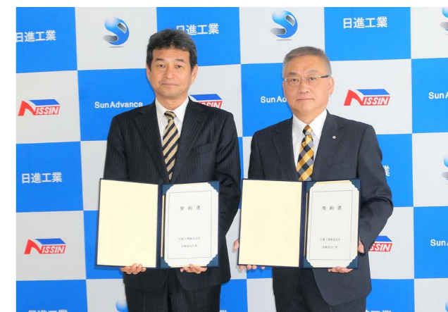
▲ 契約を交わす長田社長(左)と松村町長(右)

「新たな交流の第一歩」として、友好都市提携30周年の前日にあたる4月4日に契約を締結しました。