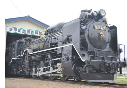
追分の鉄道の歴史が刻まれた資料館