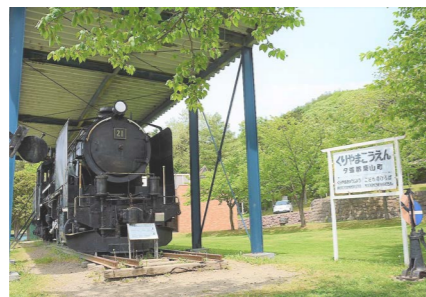
桜をそばに展示される蒸気機関車