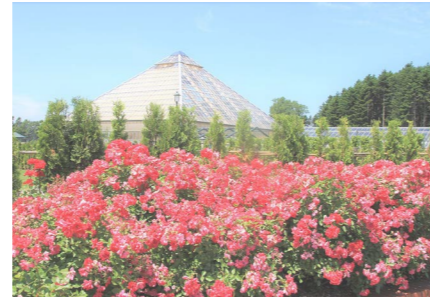
バラとハマナスが咲き乱れます