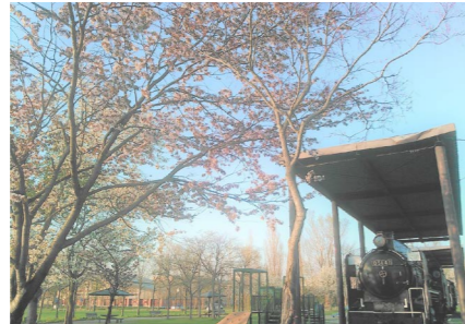
2機の蒸気機関車が並んでいます