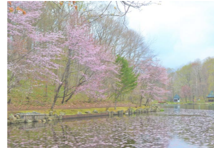
エゾシカが生息する自然公園