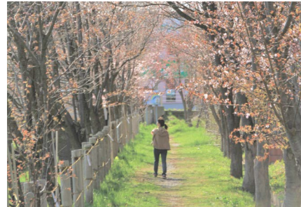
利根別川の両岸に並ぶ美しい桜並木