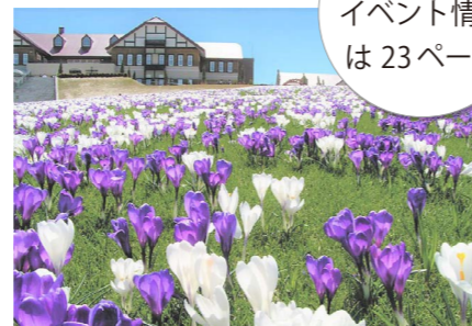
おなじみの国内最大級の英国風庭園