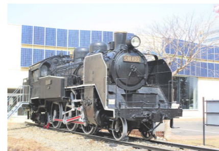
屋外には蒸気機関車を展示