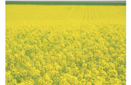
一面に広がる菜の花畑