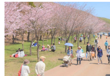
苫小牧市民の憩いの場