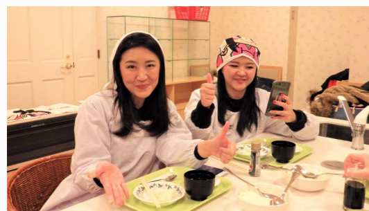
インドネシアからお越しのお客さまと お豆腐作りを体験。