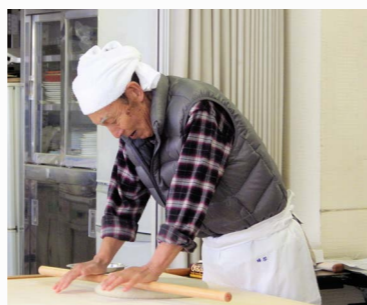
由仁手打ちそばの会の そば打ち名人。