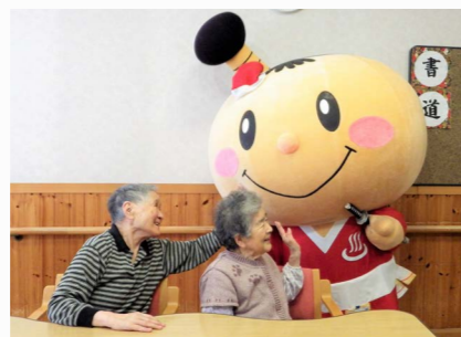
クリスマスは特別養護老人ホームも初訪問。