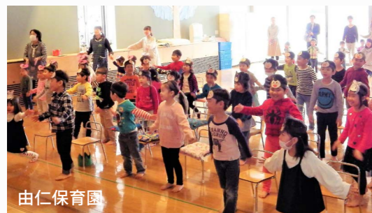
由仁保育園 ユニ殿・そらち姫と一緒に殿姫音頭を踊ったよ。