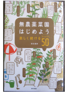
『無農薬菜園はじめよう』 麻生健洲／著

ペットボトルで害虫捕獲、花を植えて雑草防止といった畑で役立つテクニック50を紹介する。