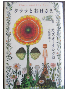
『クララとお日さま』 カズオ・イシグロ／著