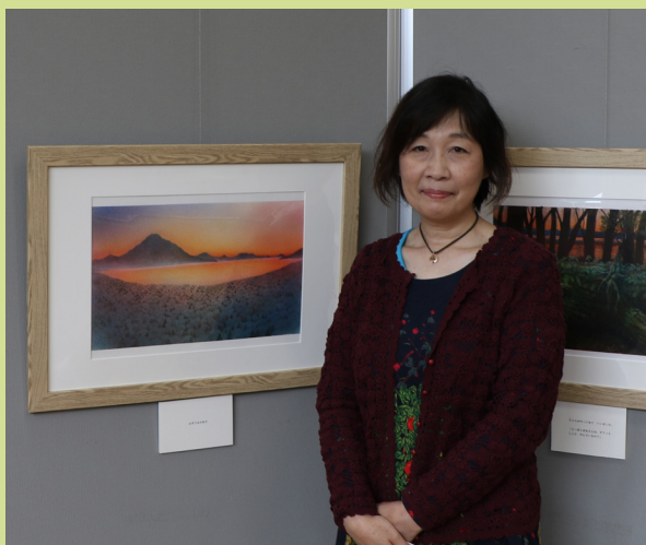
▲作品展では、イラストレーションの原画を展示