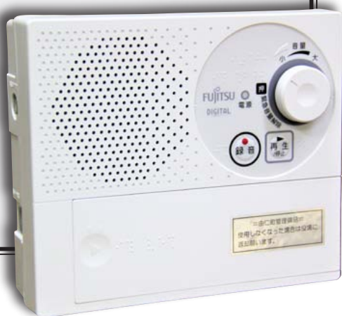
▼新しい戸別受信機