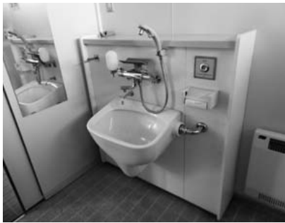
ポッポ館に設置されている オストメイト対応型トイレ

今後の増設計画については、多くの障がい者の方が利用する公共施設、あるいは観光施設に整備されている多目的トイレ、町立診療所など、整備改修費用の財源確保も含めて、今後、施設改修が必要