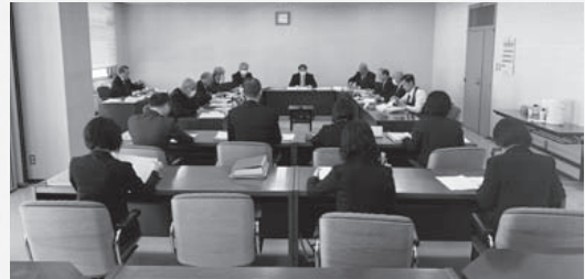
予算審査特別委員会